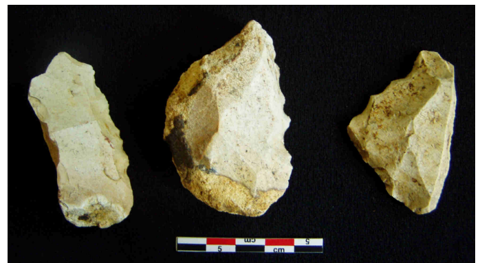
Outils des Noues Malatiers : racloir, pointes et outils denticulés.