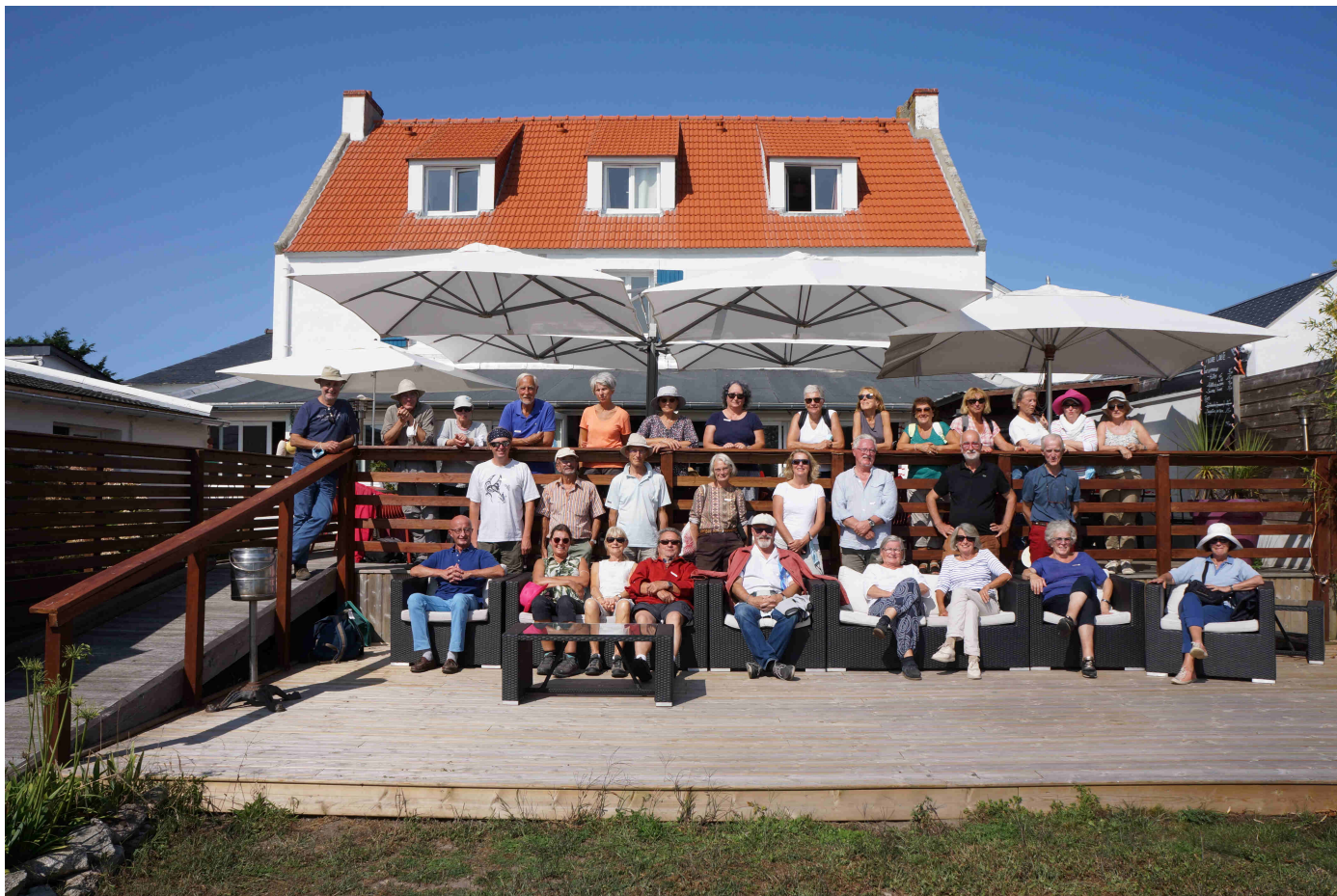
Le groupe à l'Hôtel-Restaurant « Les Cardinaux » après la pause déjeuner